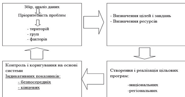
Рис. 1. Концептуальна модель соціально-гігієнічного моніторингу.

часу доби, пори року, інтенсивності руху транспорту, відстані від джерел забруднення тощо [8].