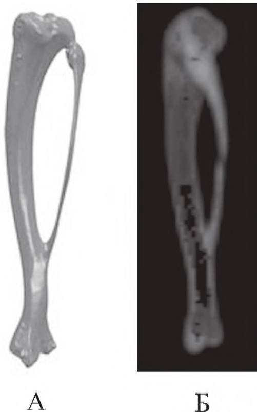
Рисунок 1 - Вимірювання МЩКТ гомілкових кісток щурів. Трабекулярний шар проксимального кінця великогомілкової кістки знаходиться від ділянки метафізу до дистальної зони зони діафізу (визначена на рівні 30% від загальної довжини кістки). Трабекулярний шар був відокремлений від кортикального шару автоматично визначеними контурними лініями під час аналізу отриманих сканів. А – 3D-модель гомілкових кісток. Б – КТ-скан кістки, використаний для денситометричного аналізу

від 294,1 \pm 15,2 до 308,3 \pm 17,4 мг/см 3 . Ми спостерігали зниження МЩКТ трабекулярного шару гомілки за умови моделювання ожиріння та малорухомого способу життя (група I). Проте у групі II, де додатково вводили вібрацію всього тіла (0,3 g), мінеральна щільність була значно вищою за дослідну групу I, хоча показник не досягав рівня контролю (рис. 2).